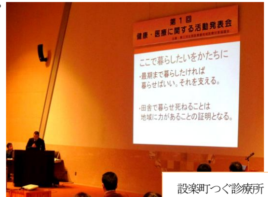
設楽町つく診療所

医療機関、介護・福祉機関、地域住民それぞれの立場や視点から実践報告・提言がありました。