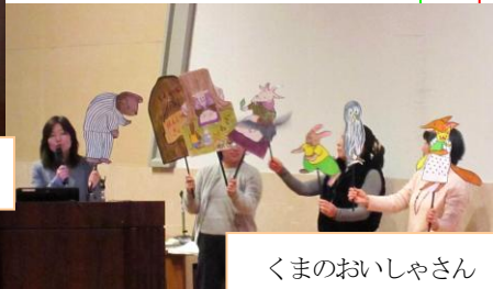
くまのおいしゃさん