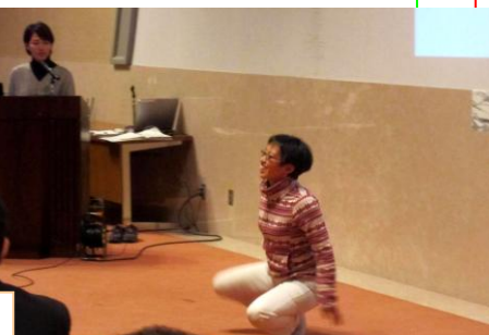
つばさ共同保育園