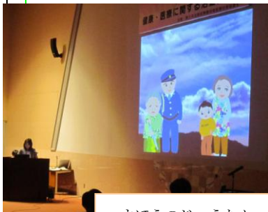
まほうのじゅうたん

地域住民で構成される4組の発表は、充実した資料や実演を交えた報告を行い、自身の活動内容を熱心に伝えていました。