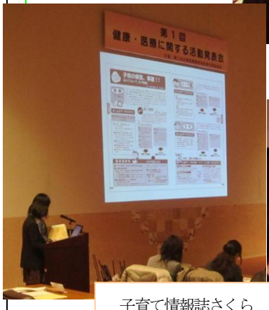
子育て情報誌さくら