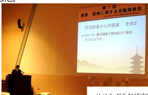
せせらぎ会包括支援センター

認知症に関するユニークな取り組み、高齢者に対する介護サービス提供状況や関係機関との連携状況などの報告がありました。